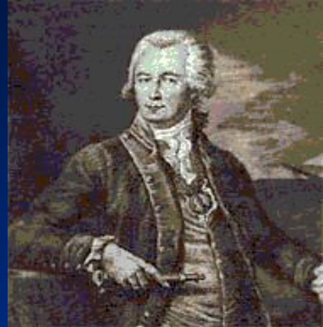
• Г.И. Шелихов.