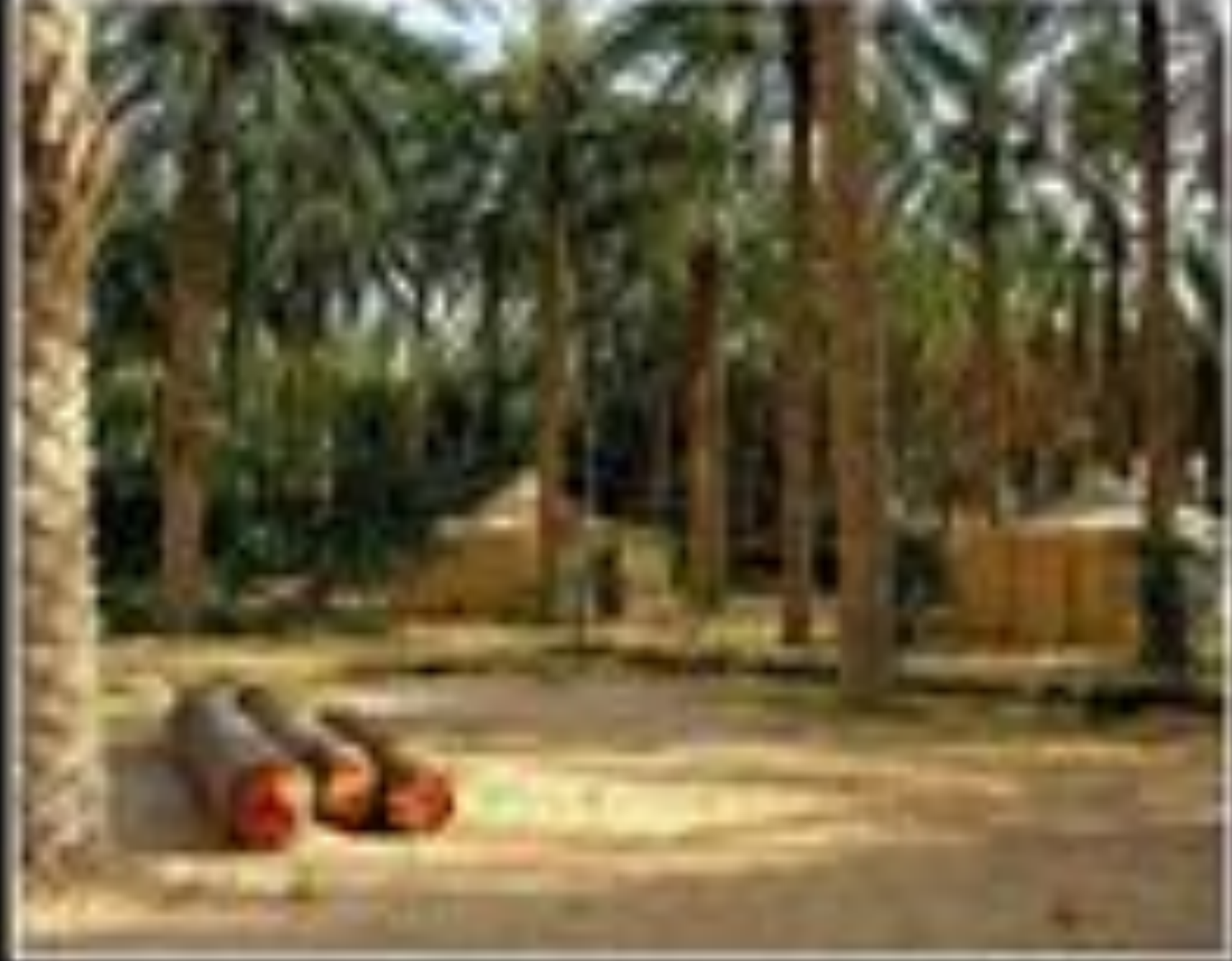
Highway 100, Cuba