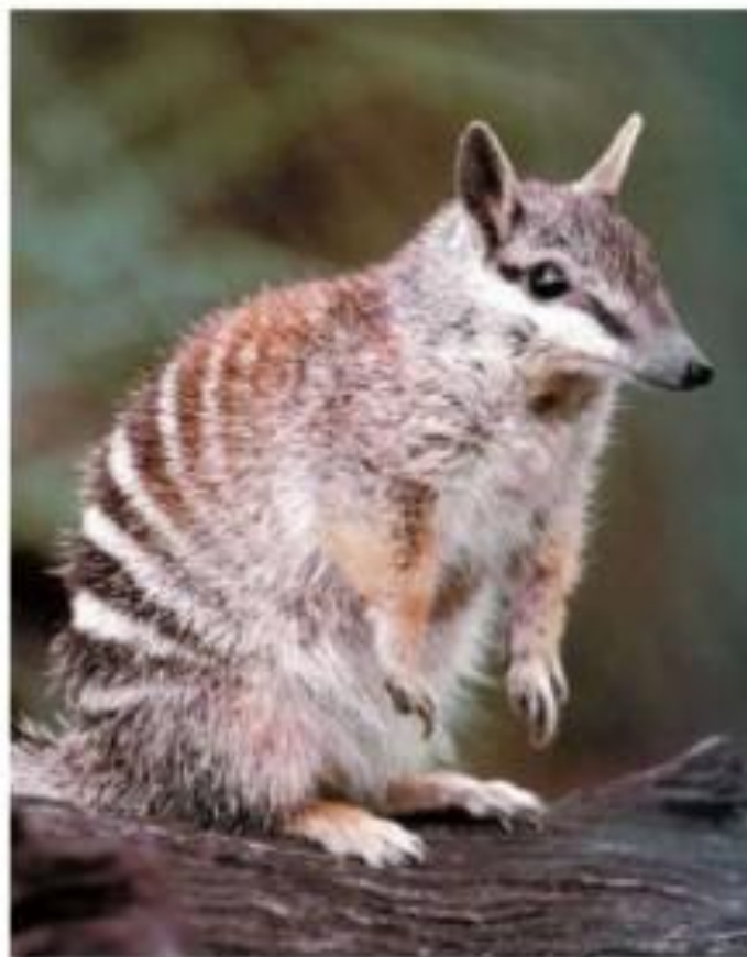
Намбат - сумчатый муравьед

Хотя Австралия имеет природные зоны, которые есть и на других материках, природа ее эндемична (т.е. представители больше нигде не встречаются)