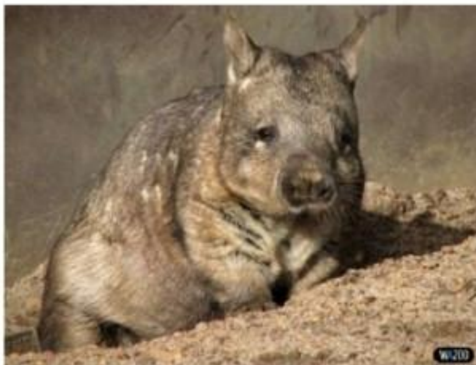
Вомбат – сумчатый грызун, живущий в норах с вывернутой вниз сумкой