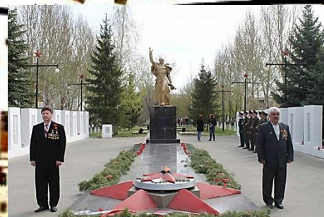
Угольный разрез «Коркинский»