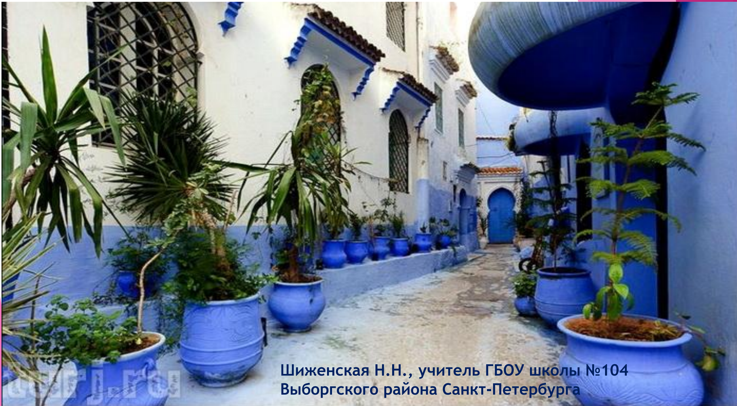
Шиженская Н.Н., учитель ГБОУ школы №104 Выборгского района Санкт-Петербурга