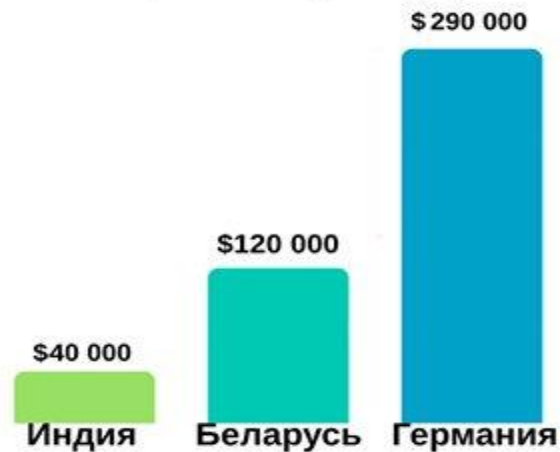
сравнение цен на пересадку печени

На сегодняшний день Индия завоевывает популярность как место лечения, помимо того, что является популярным туристическим направлением среди путешественников. Таким образом, сочетание медицинского лечения и туризма привело к такому понятию как медицинский туризм. Индия является идеальным местом для медицинского туризма благодаря высококлассному медицинскому обслуживанию, низкой стоимости лечения, медицинскому оборудованию и аппаратуре мирового уровня, индивидуальному подходу при уходе за пациентами и, что наиболее важно, нулевому сроку ожидания до операции. Индия занимает второе место по количеству медицинских туристов в мире, согласно результатам недавнего исследования, проведенного аналитической компанией Deloitte.