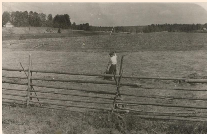
Изгородь из жердей