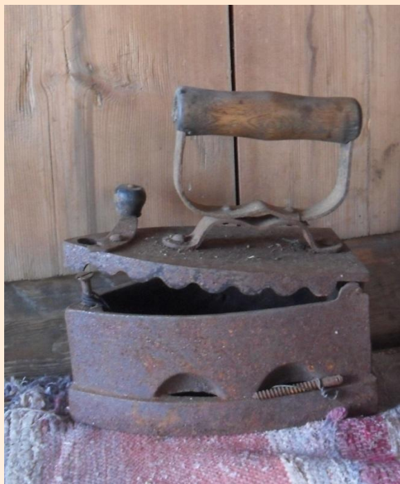
Утюг, разогреваемый с помощью горячих углей