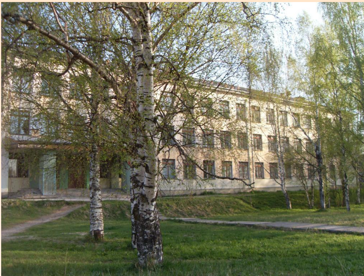
Солгинская СШ № 86