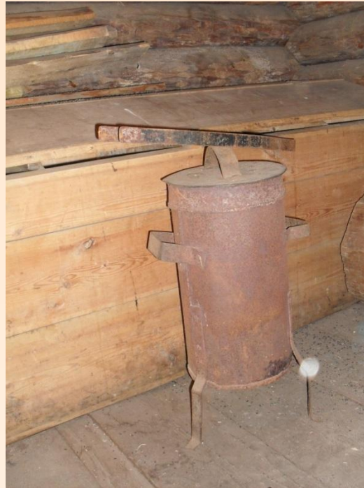
Тушилка для углей