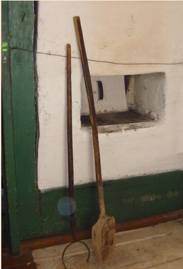
Ухват и лопата у русской печи