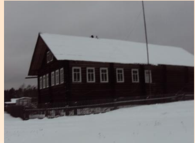
д. Рылковский Погост