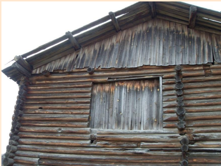
Ворота на повить