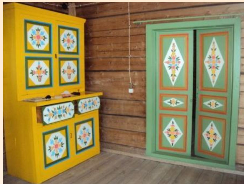
Шкаф и дверь («реставрированы»)