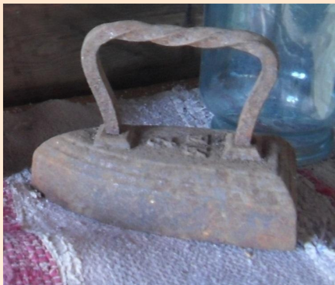
Утюг, который грели в печи или на шестке перед топящейся русской печью