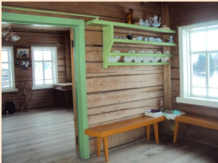
Полица с посудой