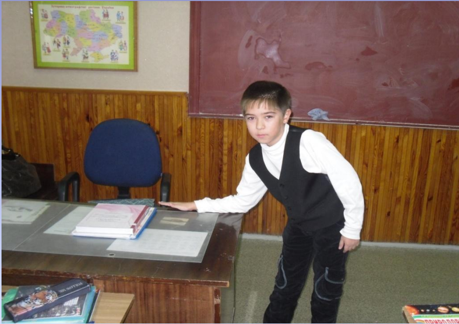
Обучение действием ( Природоведение 5 кл.) Измерение длины учительского стола в «локтях»