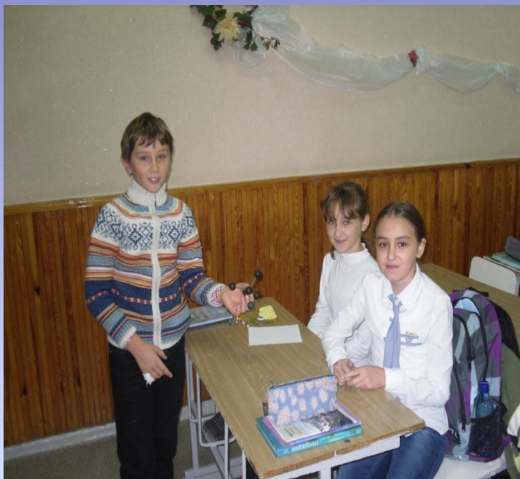
Познавательный интерес. (Знакомство с молекулой метана)