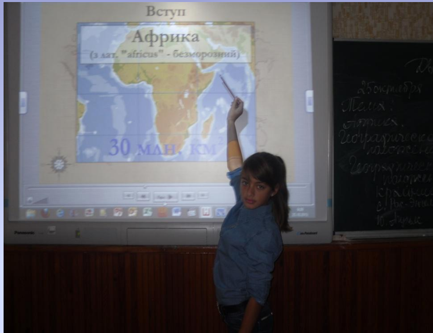
География 7 кл.