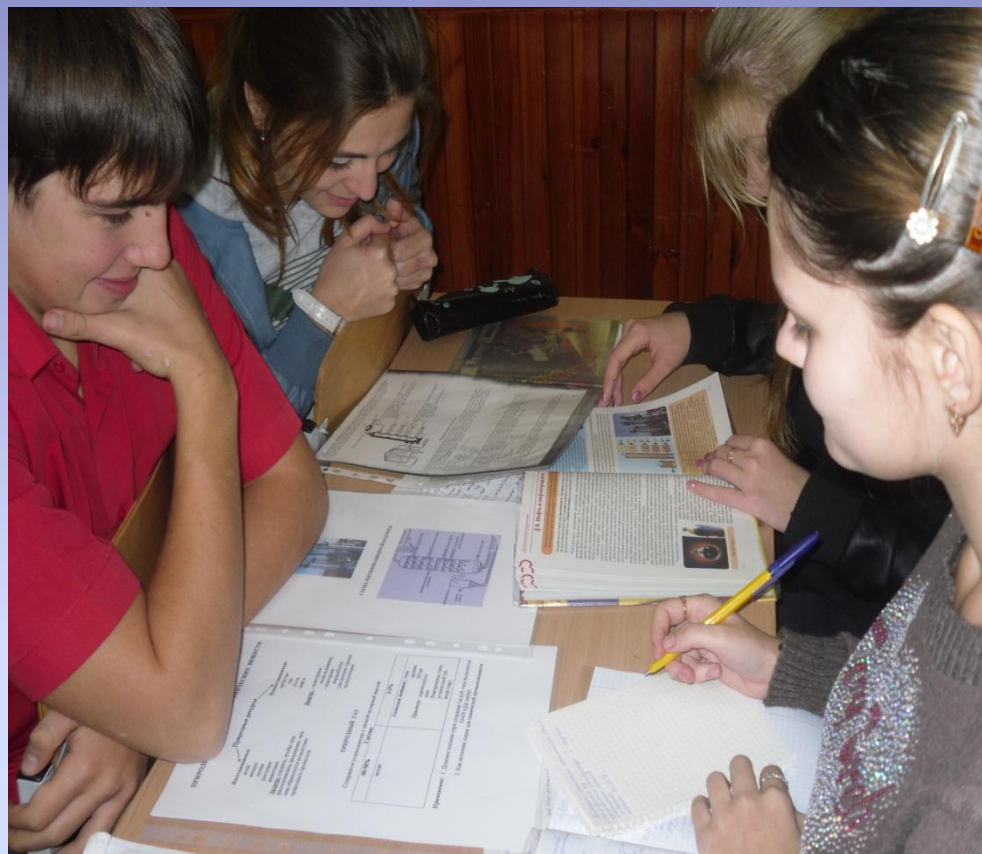
Развивающая кооперация. (Парная и групповая работа)