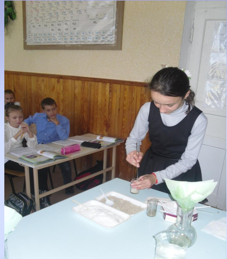
Исследовательский практикум (Природоведение 5 кл.) Разделение смесей фильтрованием