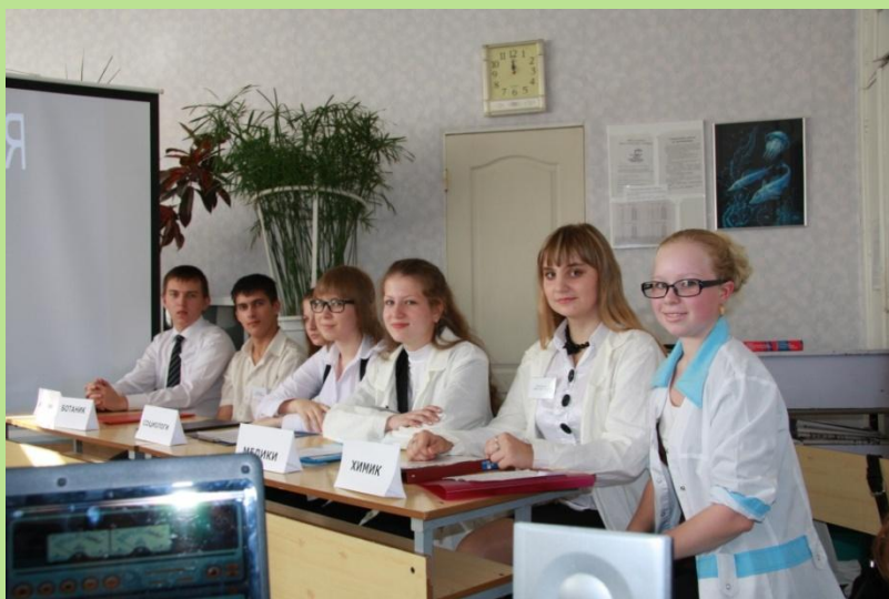
Экологическая игра «Здорово быть здоровым»