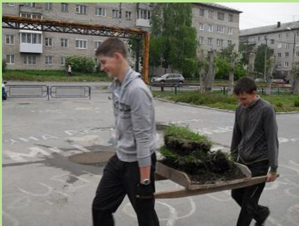
Летний трудоу лагерь за работой