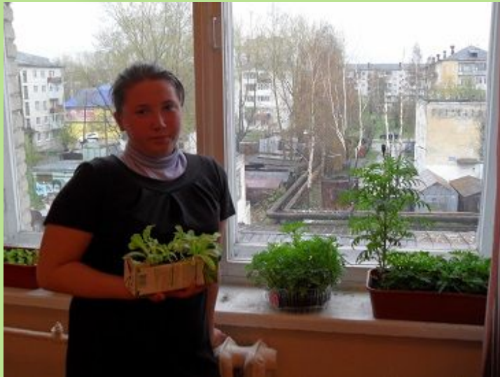
Выращивание рассады в классах