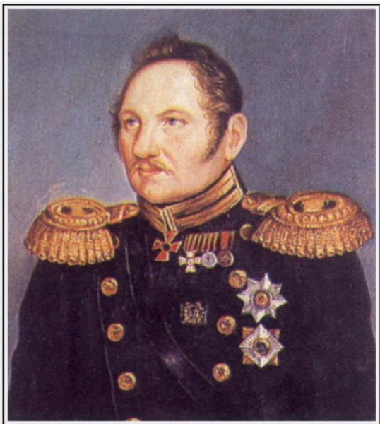
Фаддей Беллинсгаузе н «Восток»