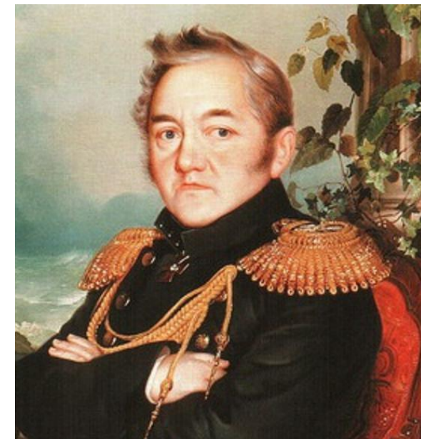
Михаил Лазарев «Мирный»