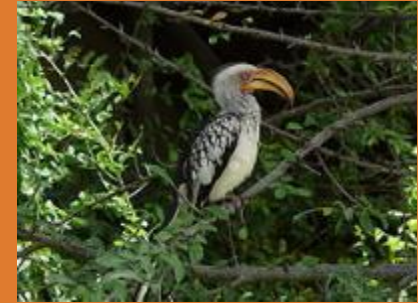
Токо Tockus leucomelas