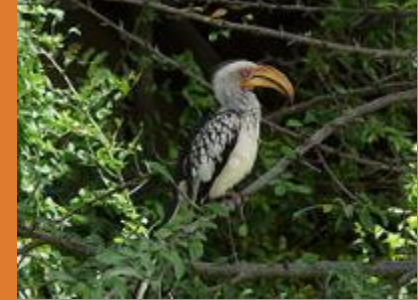
Токо Tockus leucomelas