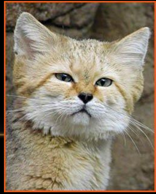
Своенравная барханная кошка

Засушливые земли национального парка населяет 23 вида крупных млекопитающих. Среди них взъерошенные муфлоны (гривистые бараны), каракалы, гепарды, камышовые коты и барханные кошки.