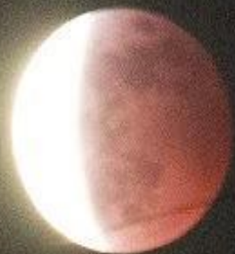
«Красиво, аж жуть берет.»

Вот она, настоящая кровавая луна, снятая в Ангарске.