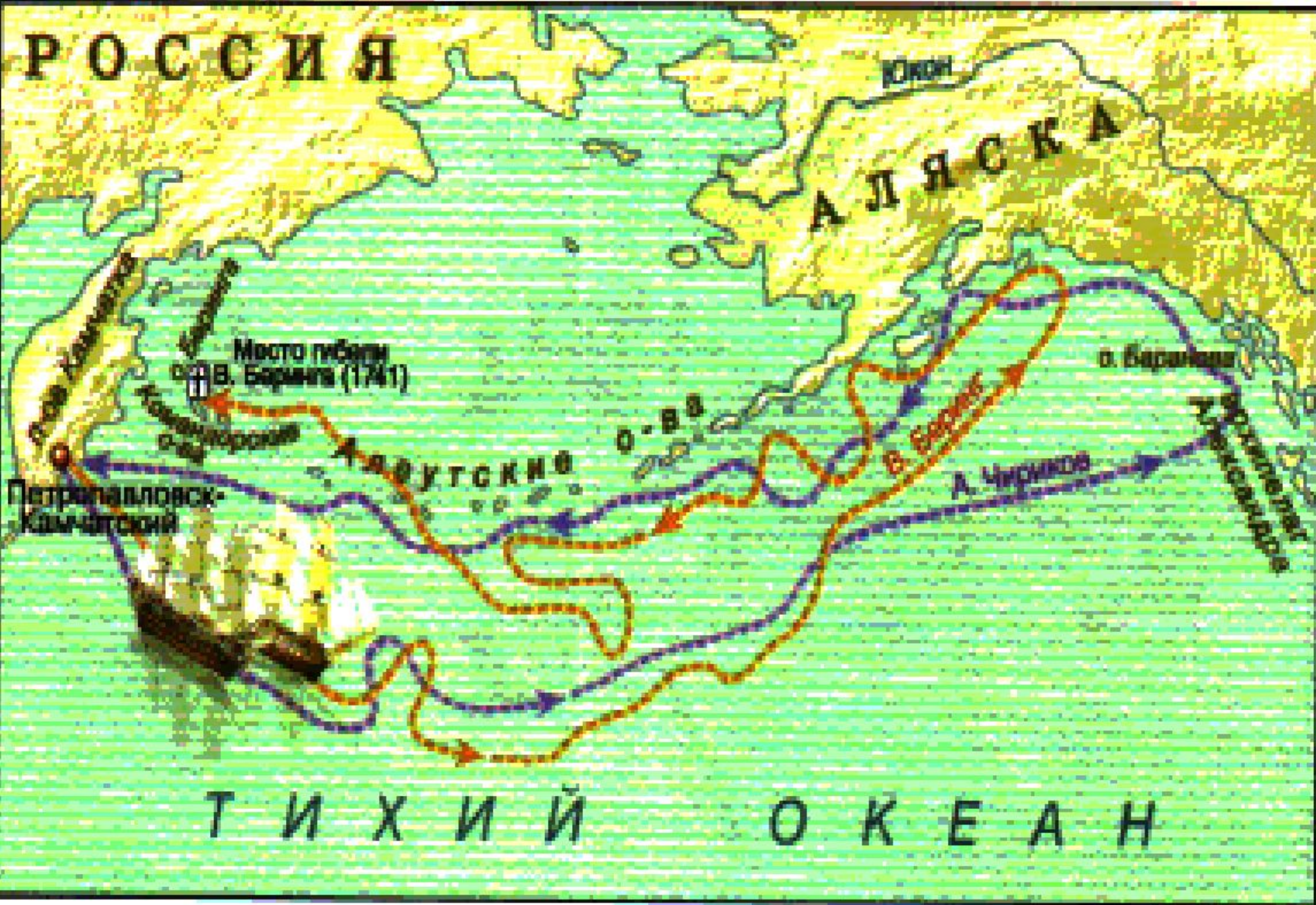
Рис. 48. Путешествие В. Беринга и А. Чирикова