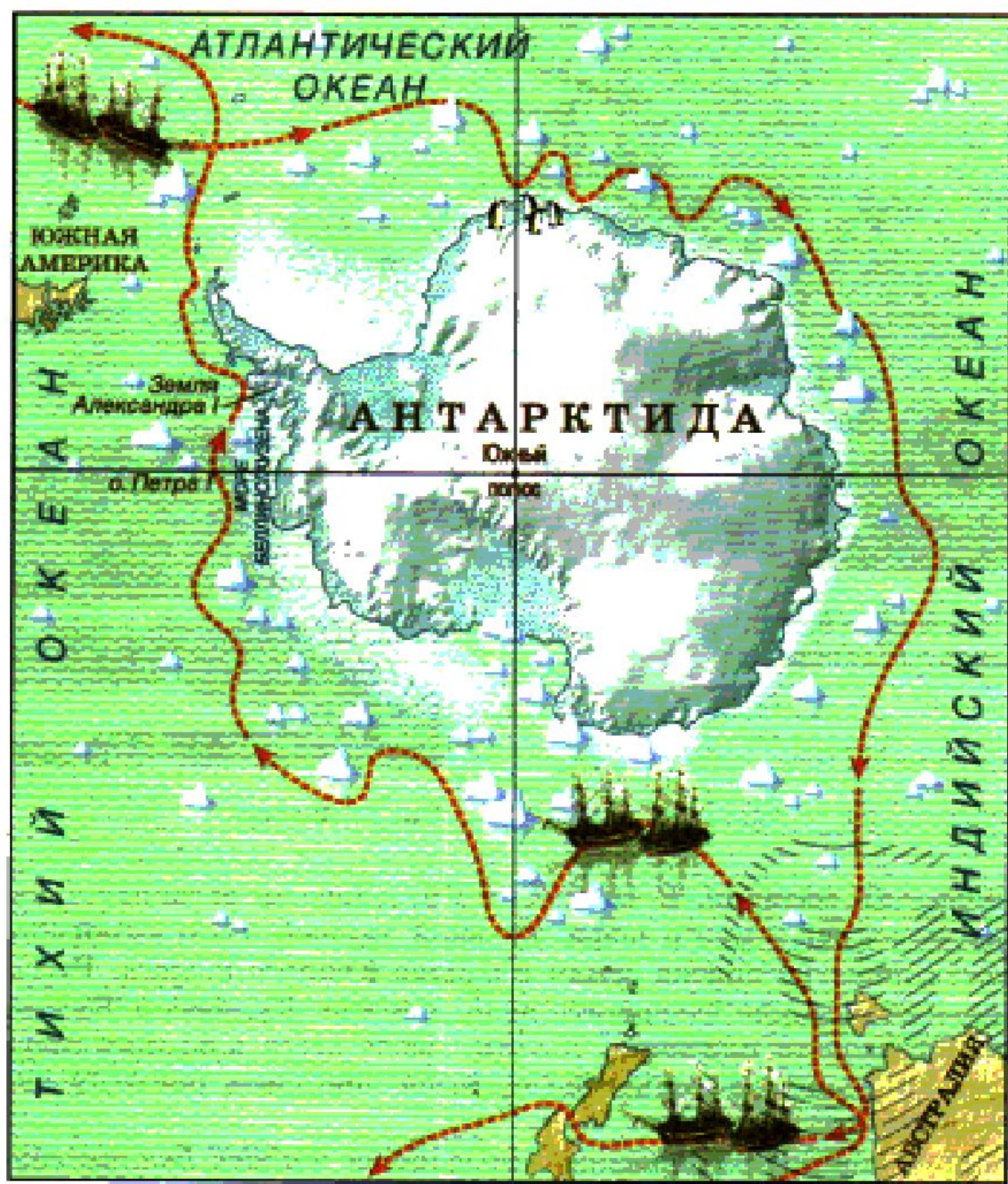
Рис. 52. Плавание Ф. Беллинсгаузена и М. Лазарева