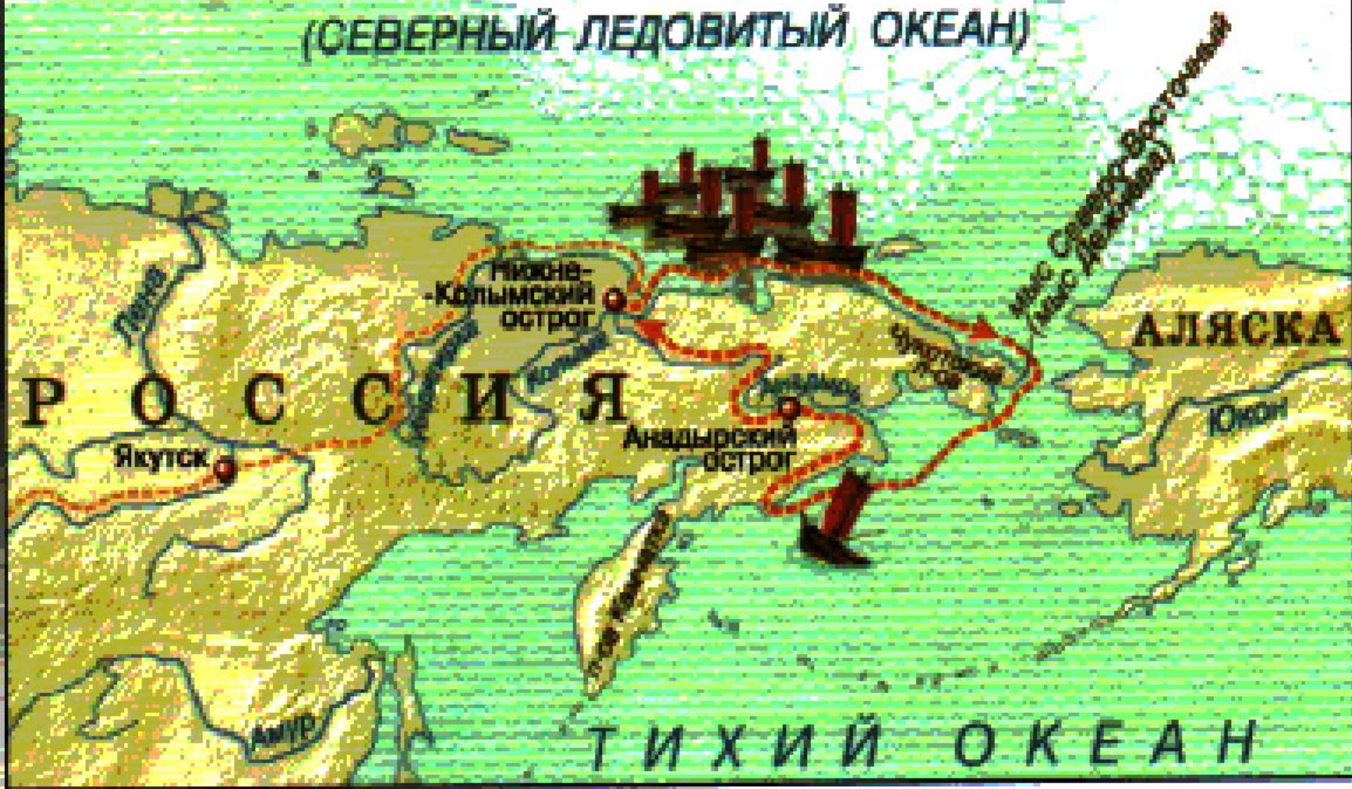
Рис. 47. Путешествие Семёна Дежнёва