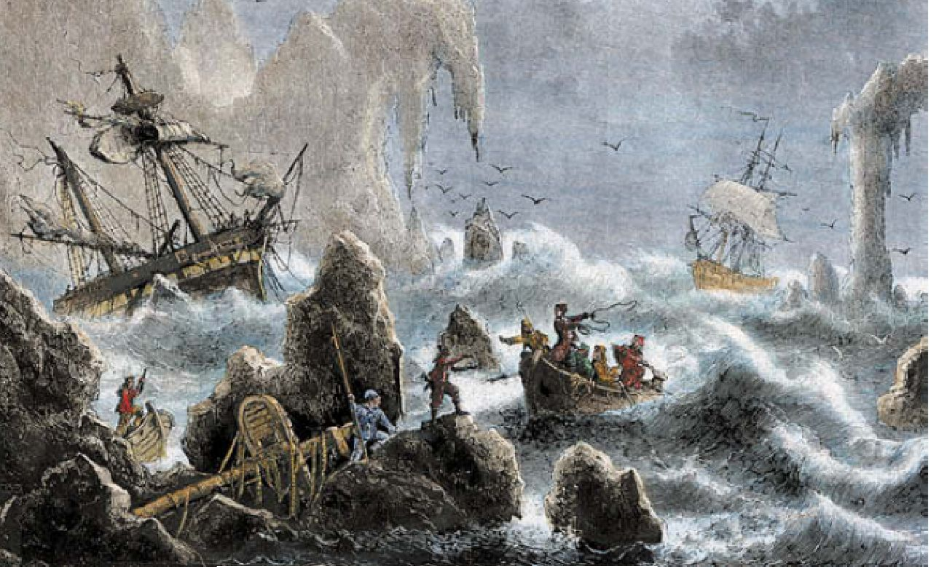
Корабли экспедиции В. Беринга в штормовом море у Алеутских островов