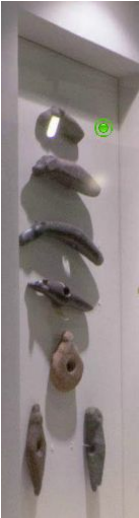
Орудия и посуда древних людей