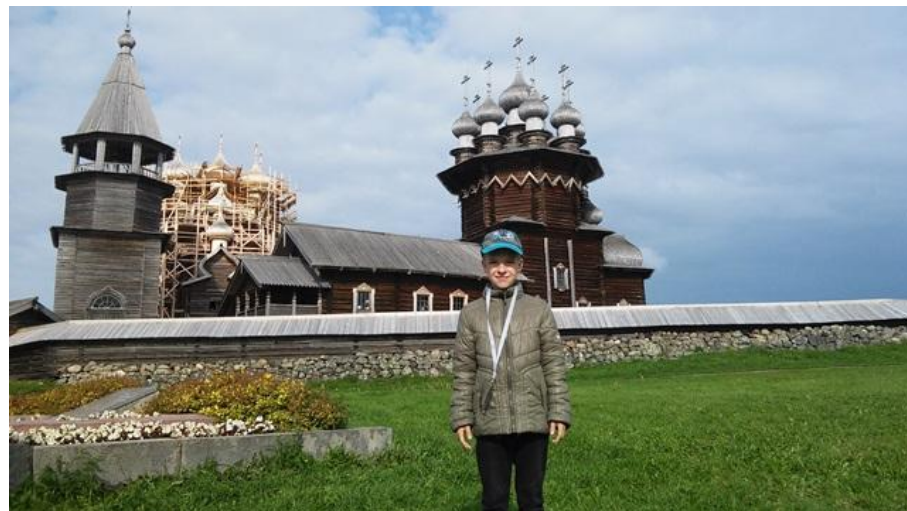
Церковь Преображения Господня