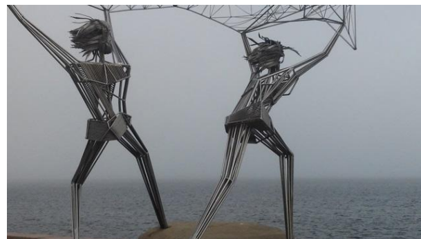
Скульптуры от городов-побратимов