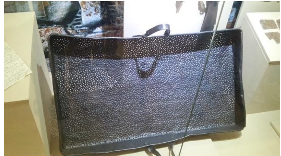
Сито для промывки железной руды. XVII век.