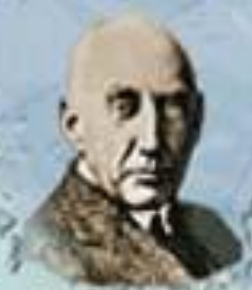
Р. Адмундсен 1912 г.