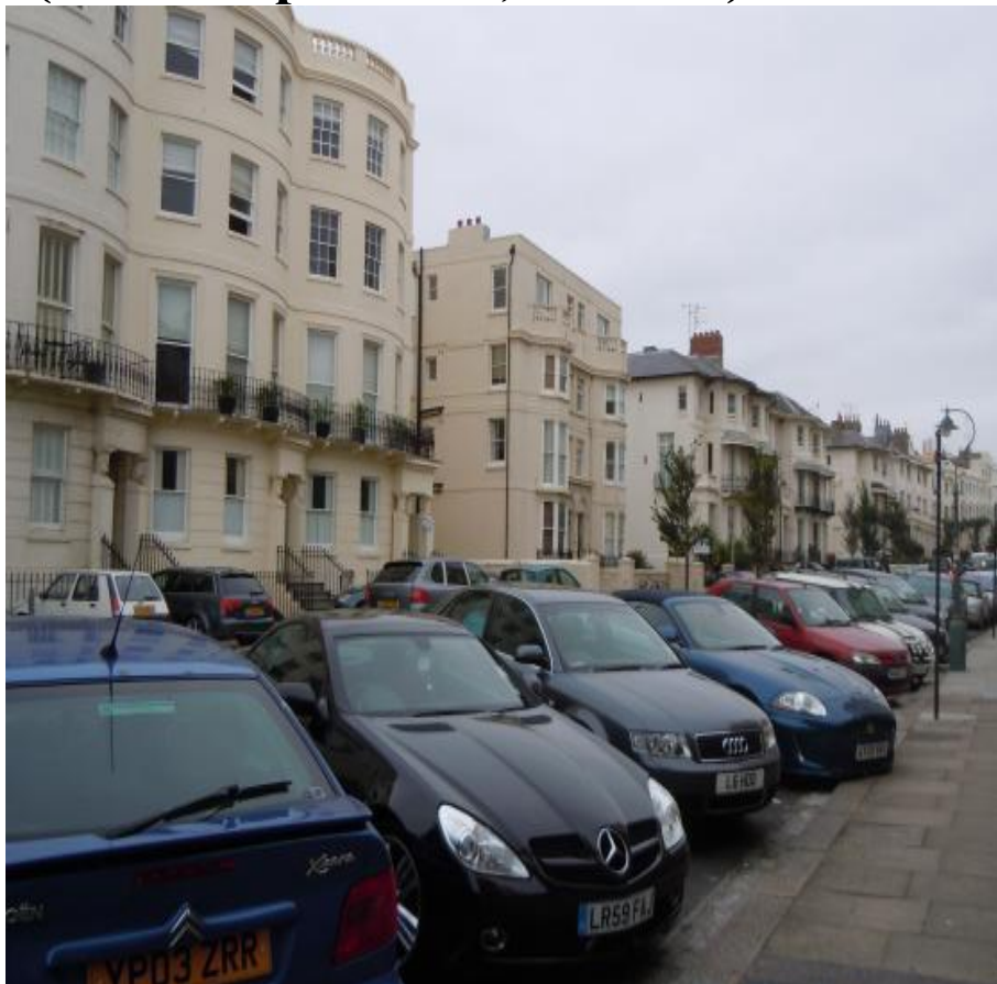
Город Брайтон (Великобритания, Англия)