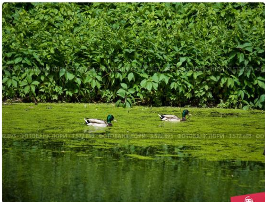
Два селезня на заросшем ряской пруду