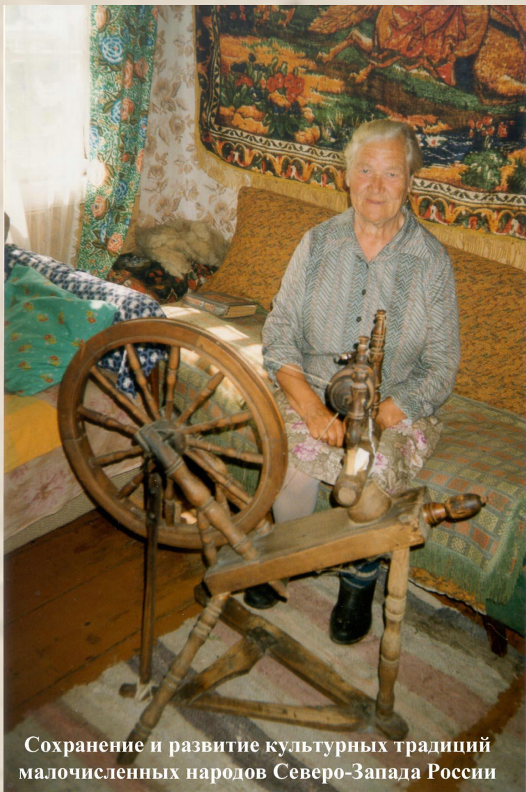
Сохранение и развитие культурных традиций малочисленных народов Северо-Запада России