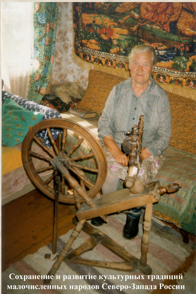
Сохранение и развитие культурных традиций малочисленных народов Северо-Запада России