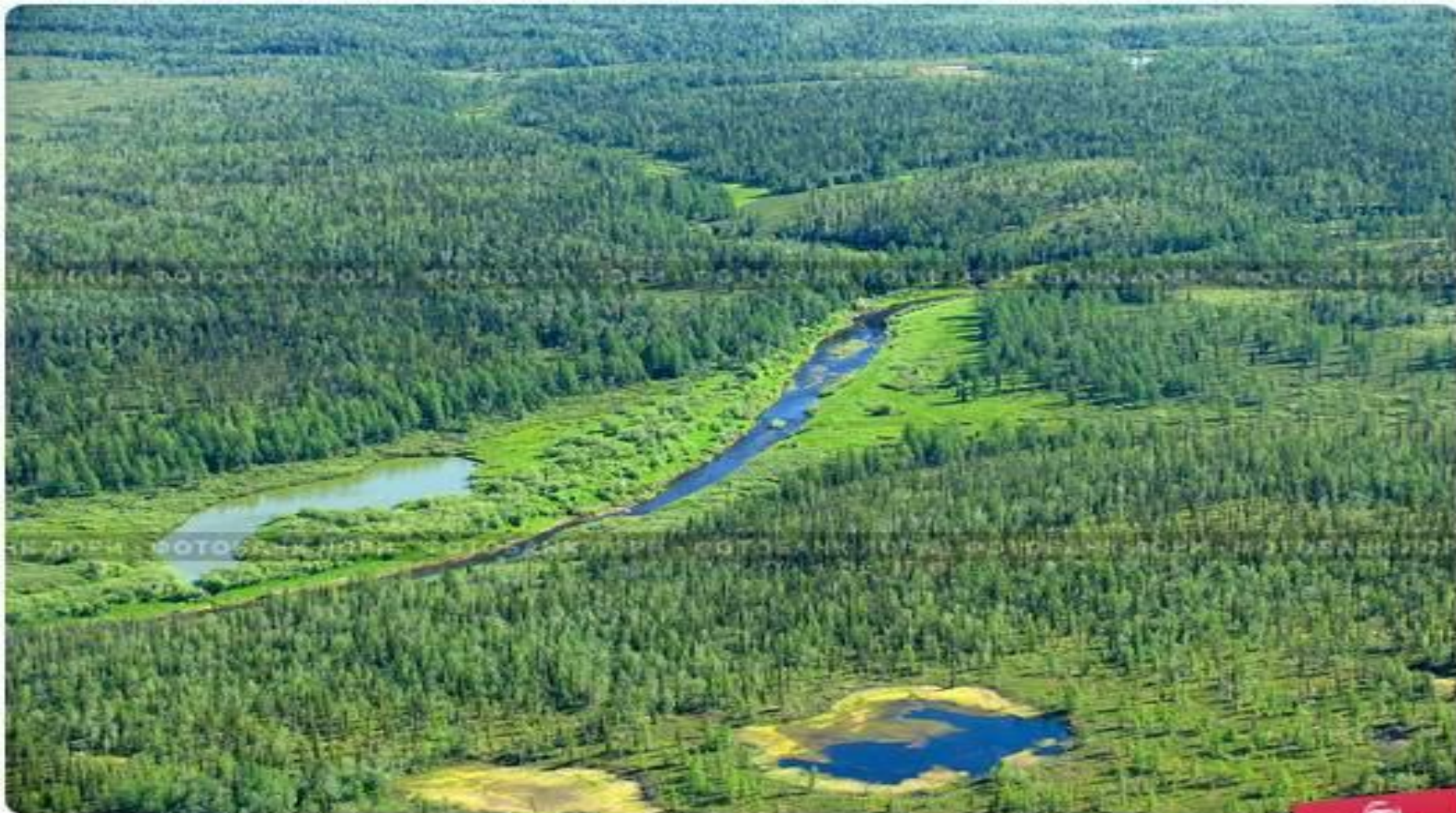
Сибирская тайга - вид с воздуха