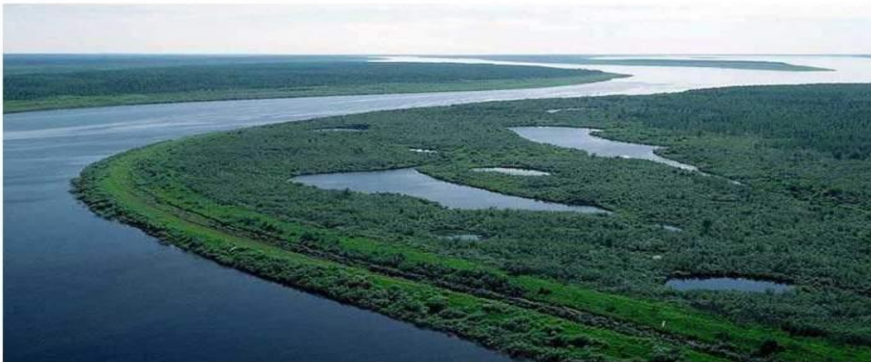
Река Енисей, Россия