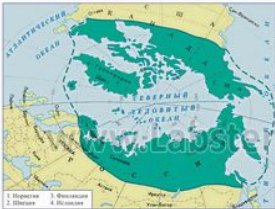
Доля зоны Севера в общей площади стран