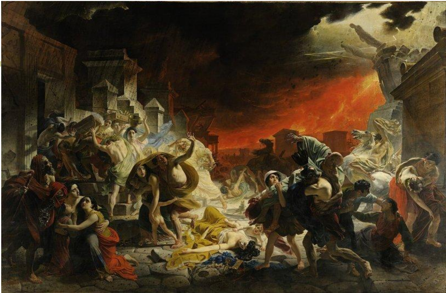
«Последний день Помпеи» Карл Брюллов