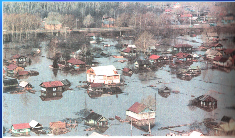
Разрушения, вызываемые наводнениями