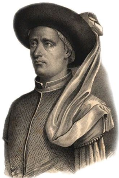
Генрих (Энрике) мореплаватель