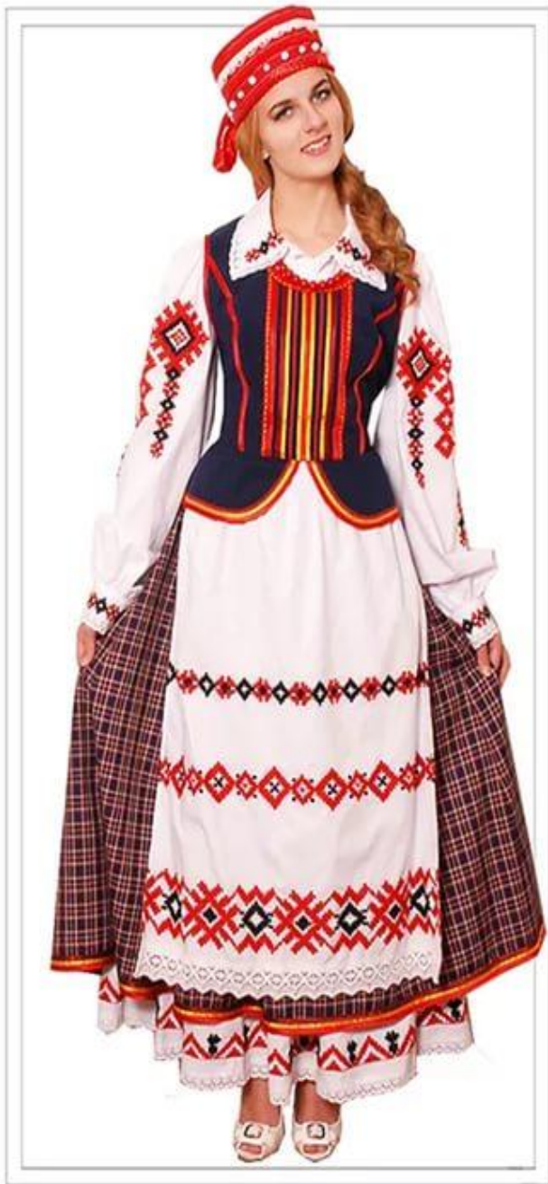
“БЕЛОРУССКАЯ КРАСАВИЦА” Арт Н180140

Самобытность белорусского костюма определяют виртуозная разработка деталей, композиционная завершённость, сочетание декоративности и продуманной практичности. Художественный образ костюма усложняли обязательные орнаментальные украшения на рукавах, вороте, фартуке, головных уборах.