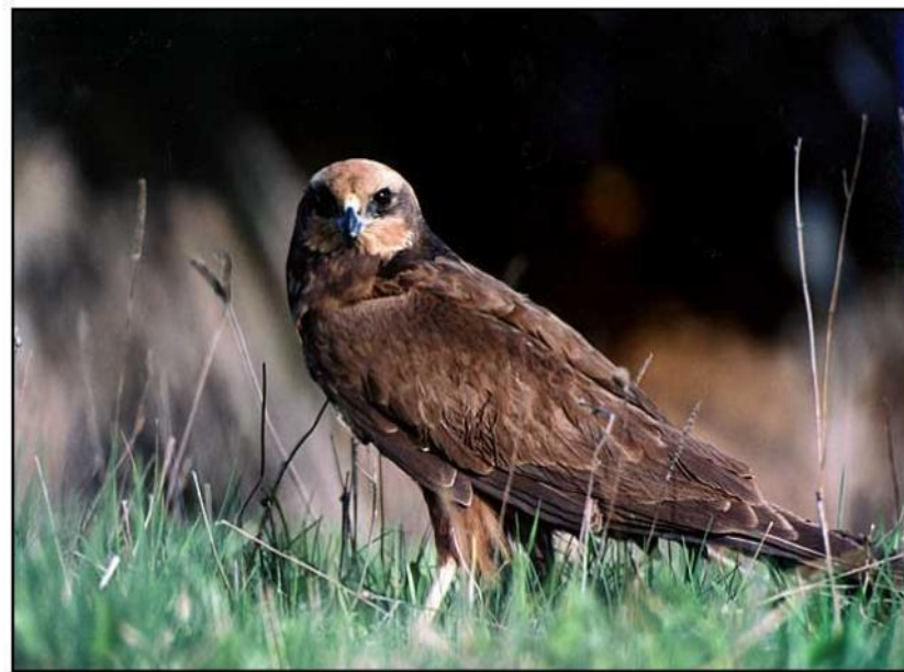
Сергей Плыжевич, 2003