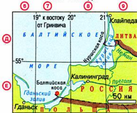
на Балтийской косе - 19^{\circ}38' з.д.