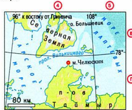
мыс Челюскин - 77^{\circ}43' с.ш.