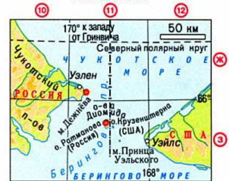
мыс Дежнёва - 169^{\circ}40' з.д. восточное побережье острова Ратманова - 169^{\circ}02' з.д.