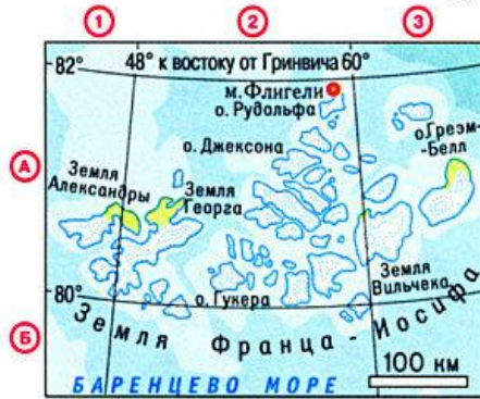
мыс Флигели на острове Рудольфа - 81^{\circ}51' с.ш.