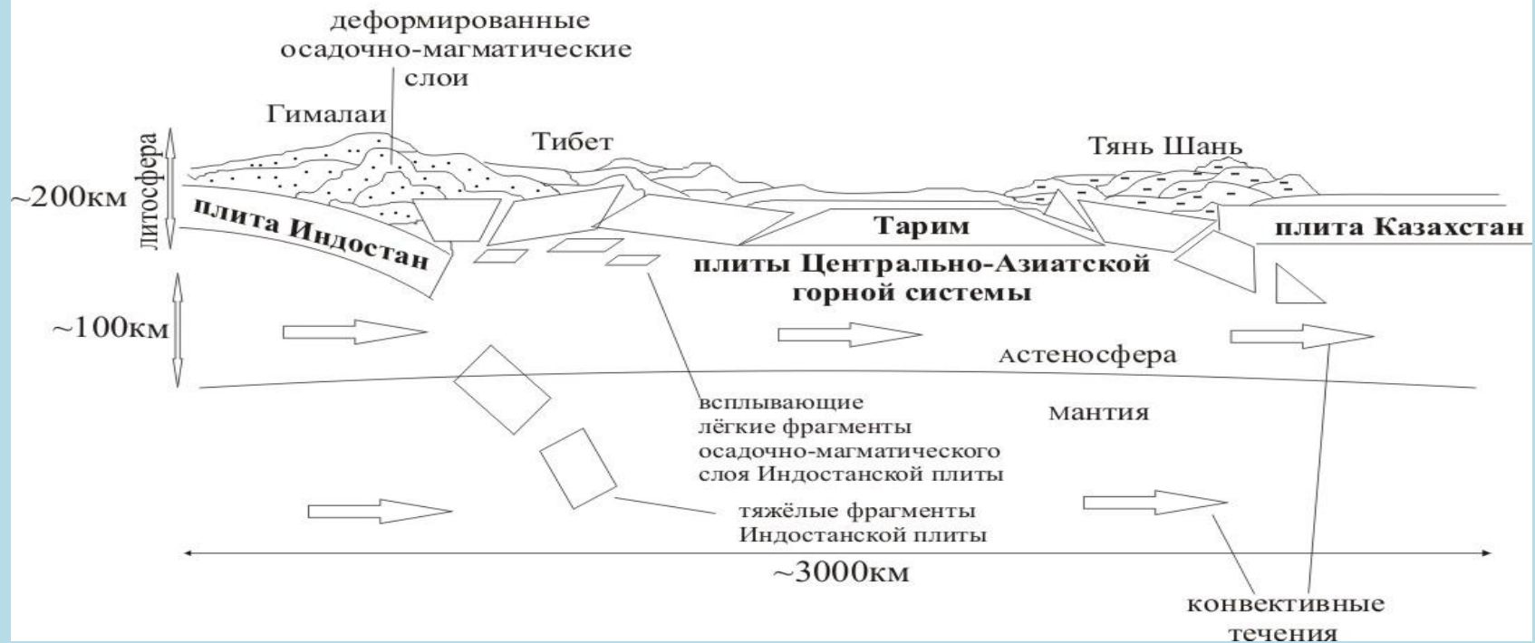
Разрез литосферы по линии Индостан - Казахстан (масштаб произвольный)