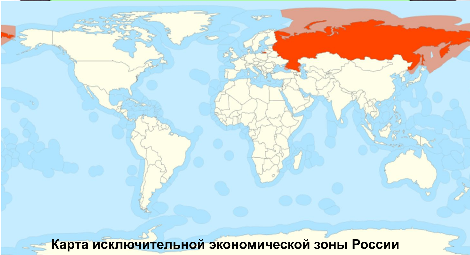
Карта исключительной экономической зоны России

200-мильная (370 км.) экономическая зона за пределами территориальных вод.