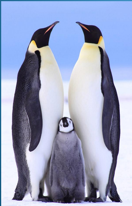
фото и текст из интернета