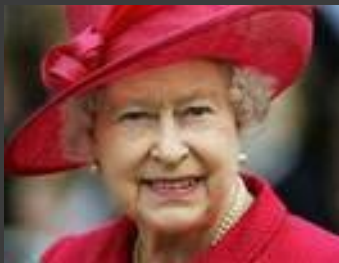
Елизавета II Королева Великобритании