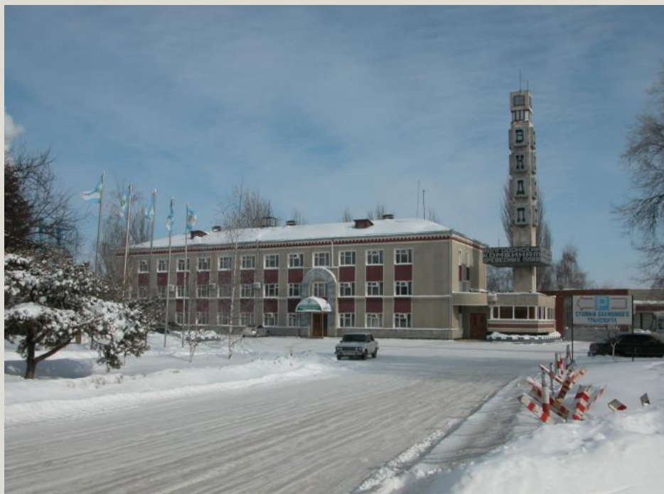
Волгодонский комбинат древесных плит