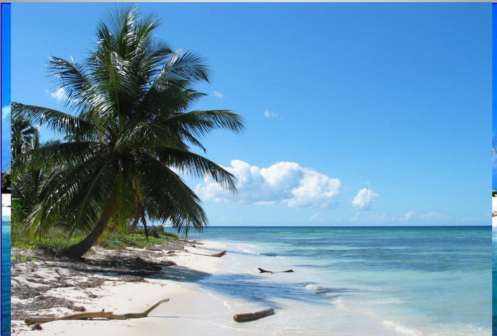
● Каймановы острова