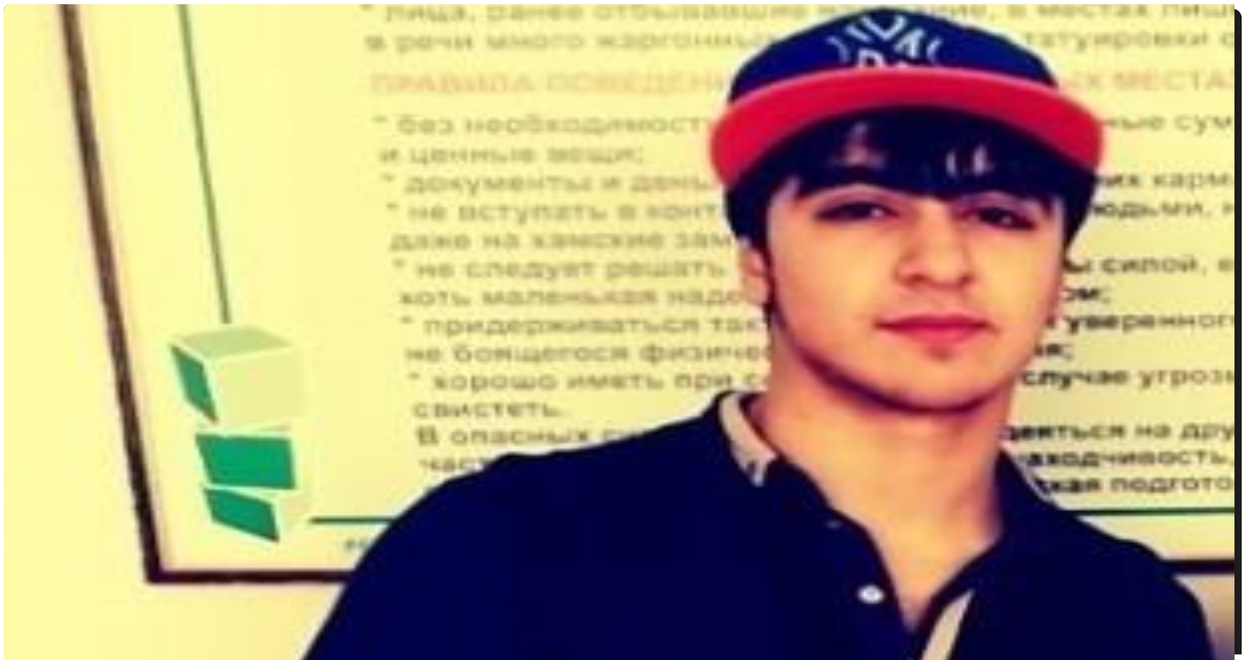
Это я средний в семье Арут (15 лет)