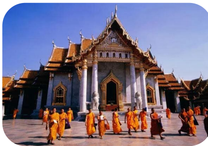
Юго- Восточная Азия