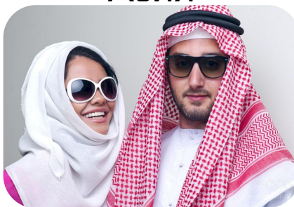
Юго- Западная Азия