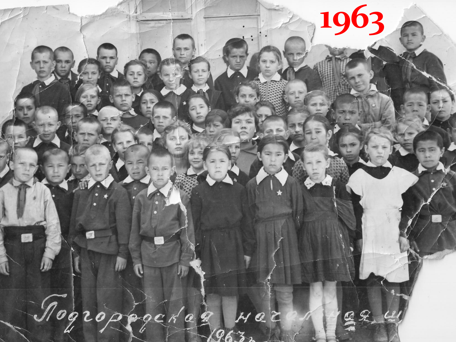
Подгородская начальная ш 1963г