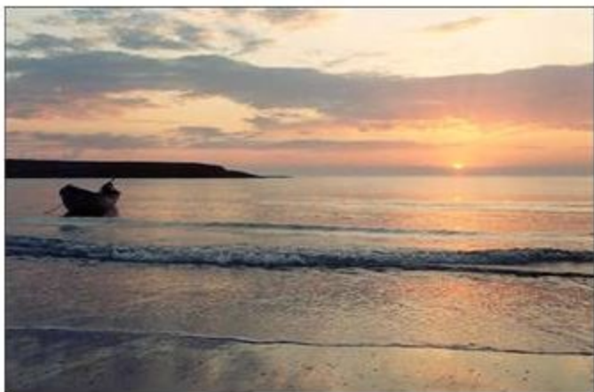
Незамерзающее Баренцево море