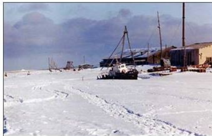
Замерзающее Белое море