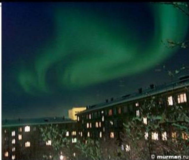
Полярная ночь. Северное сияние