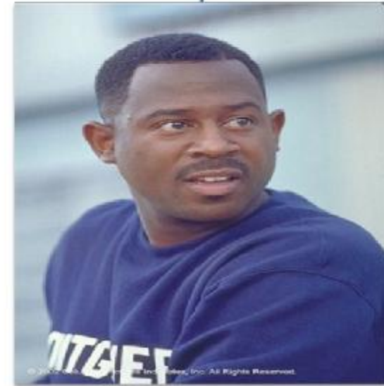
Негры (выходцы из Африки)