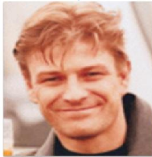
Белые (выходцы из Европы)