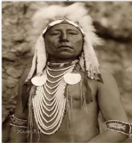
Индейцы - инки (коренные жители)