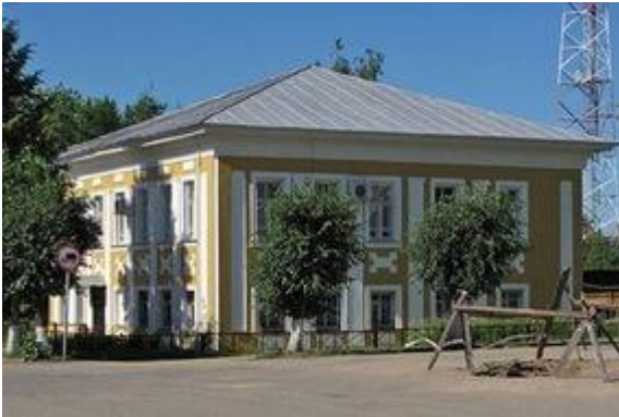
Дом купца Лобанова