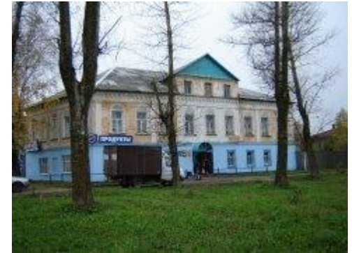
Дом купца Скорнякова

Город постепенно стал преобразовываться, появились зажиточные и даже богатые люди.