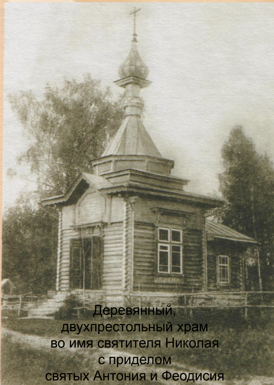
Деревянный, двухпрестольный храм во имя святителя Николая с приделом святых Антония и Феодисия