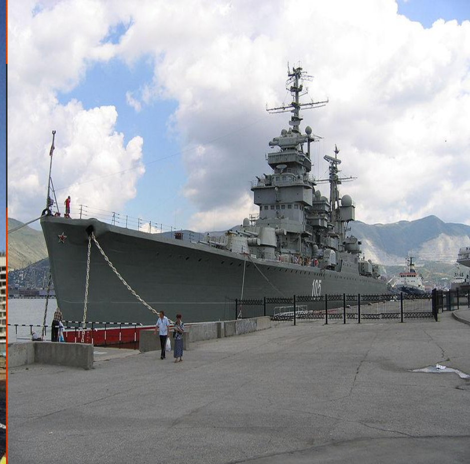
Крейсер «Михаил Кутузов»