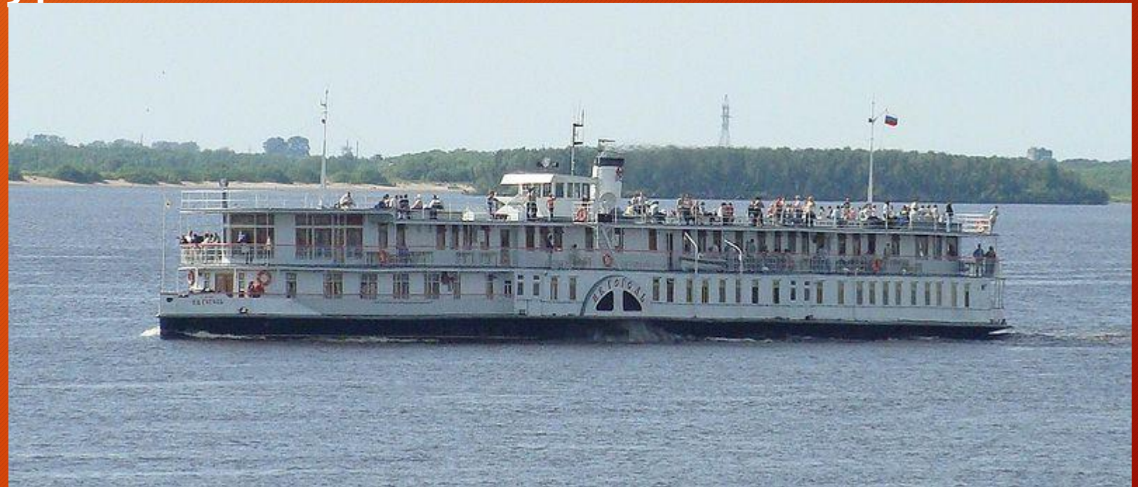
Пароход «Н. В. Гоголь» — старейшее (1911 г.) российское пассажирское судно, находящееся в эксплуатации (2015 г.)

Пароход — судно, приводимое в движение поршневой паровой машиной, иногда пароходами называют суда приводимые в действие паровой турбиной