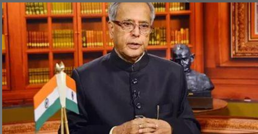
Президент или Раштрапати