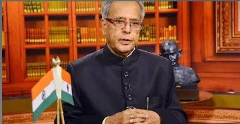
Президент или Раштрапати