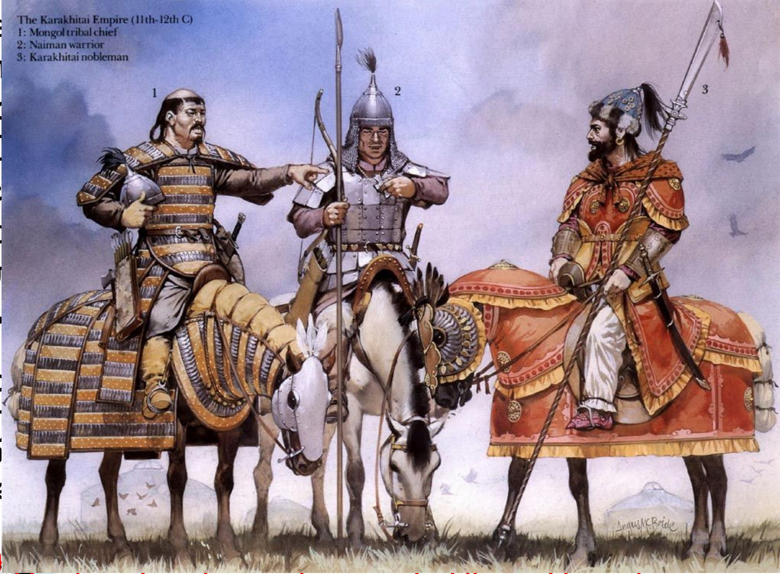
The Karakhitai Empire (11th-12th C) 1: Mongol tribal chief 2: Naiman warrior 3: Karakhitai nobleman

сов Тат эпо 100 Пе гос Бул и д раз Евр бул себ пле по До времени.