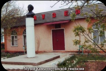
Музей Камышкунтапской гимназии