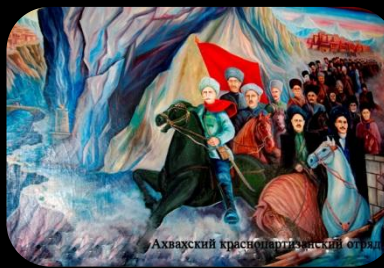
Аххажский краснопартизанский отряд