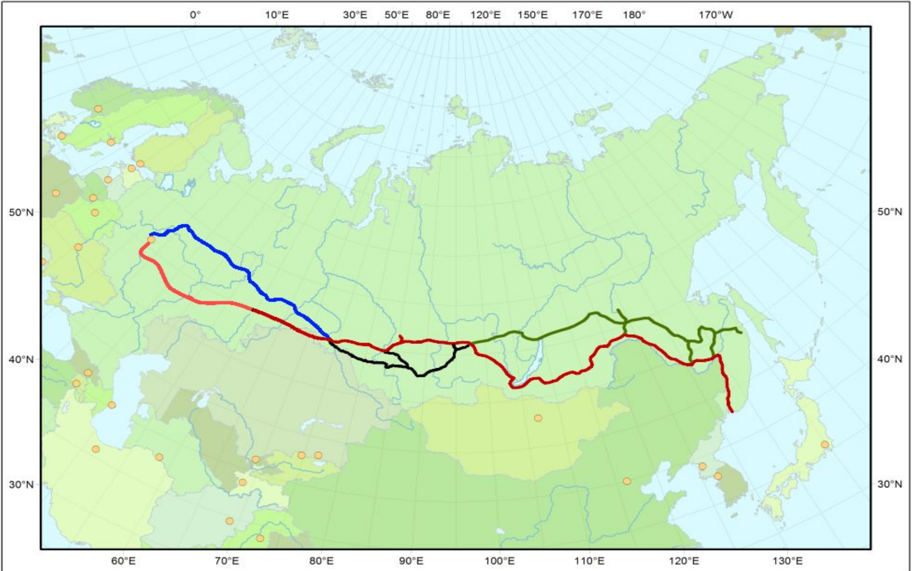
Красной линией на карте обозначена Транссибирская магистраль , зелёной — Байкало-Амурская магистраль, синей — северный маршрут, чёрной — промежуток южного пути в Сибири