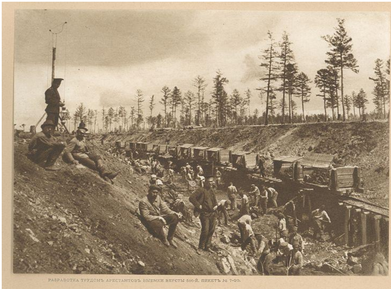
РАБВОТКА ТРУДОМЪ АРЕСТАНТОВЪ ВЪМЕМКИ ВЕРСТЫ 516-Й ПИКЕТЪ № 7-20.