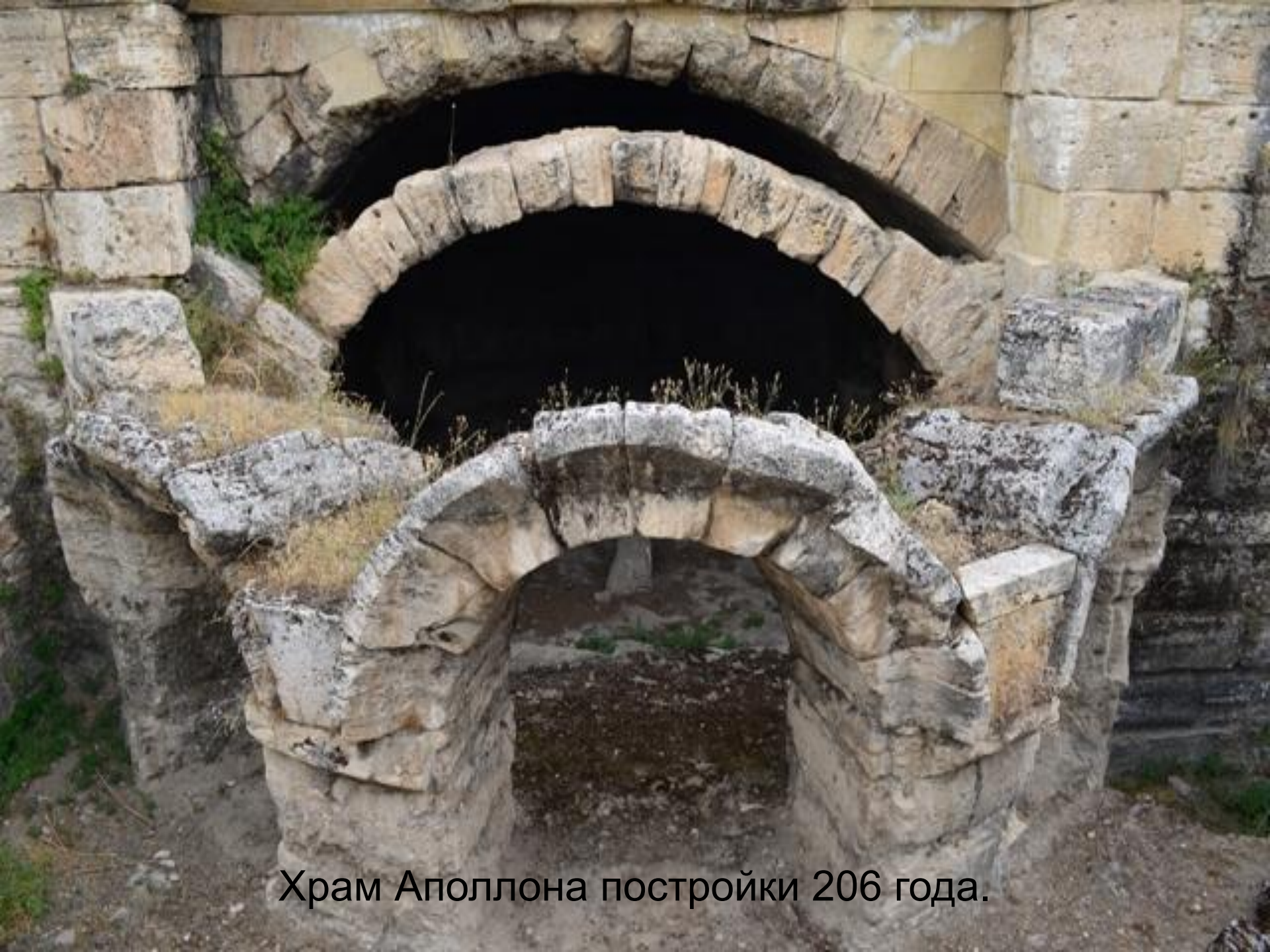
Храм Аполлона постройки 206 года.