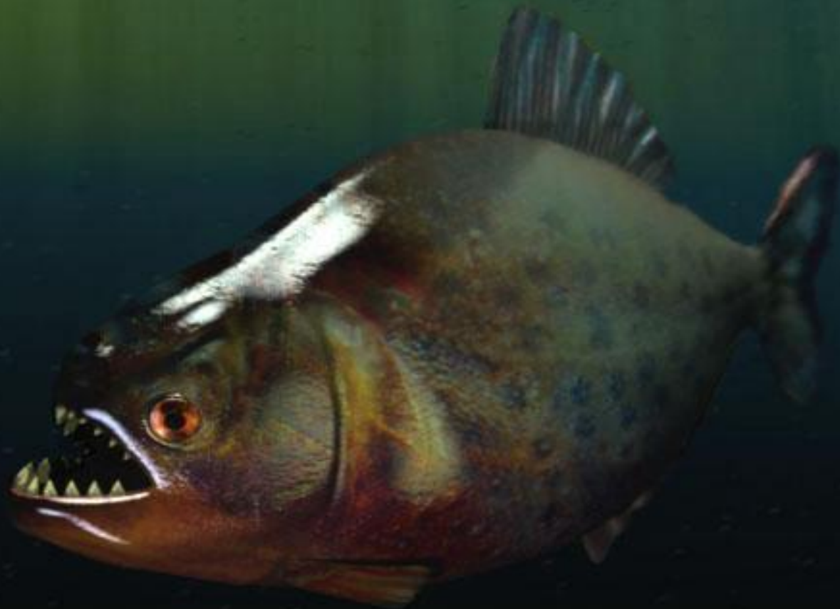
Pirahna (Serrasalmus nattereri)