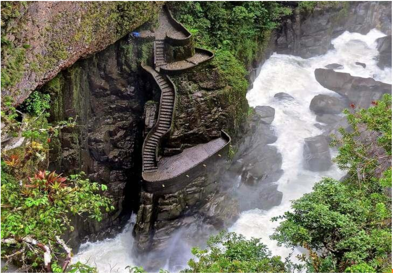
▣ 5. Водопад Пайлон дель Дьябло (Котел Дьявола)