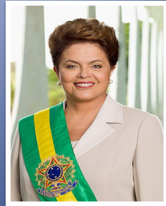
Дилма Вана Русеф