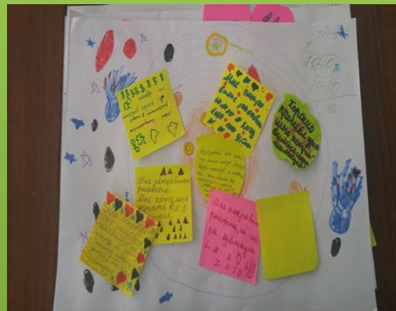
Рефлексия «Плюс- минус-интересно»