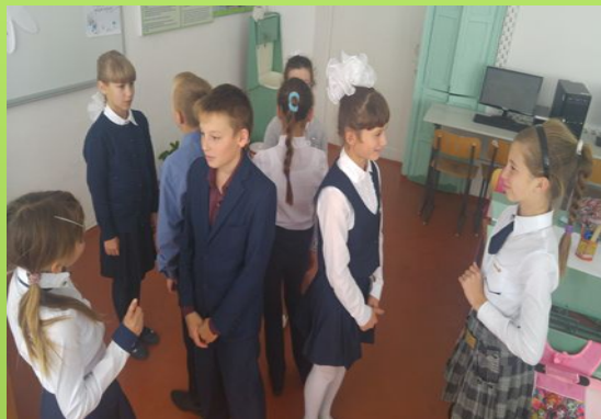
Стратегия «Сократовский круг»