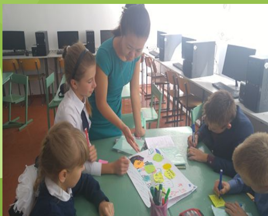
Управление и лидерство в обучении